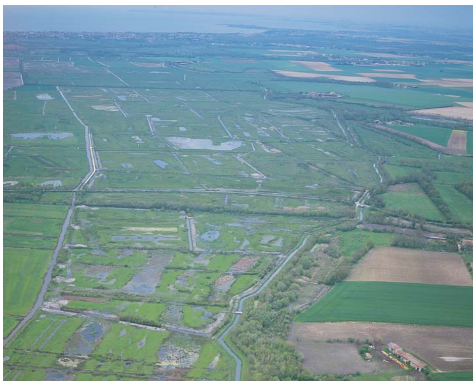
Vue aérienne du marais de Voutron.

Monsieur Michel HEUZE Sous-Préfet de Rochefort