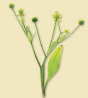
Renoncule à feuilles d'ophioglosse