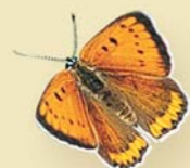
Cuivré des marais

Le Cuivré des marais est avec la Rosalie des Alpes un insecte emblématique du marais. De plus en plus rare, il apprécie les prairies de fauche et les berges de canaux où poussent les oseille sauvages.