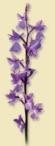
Orchis des marais