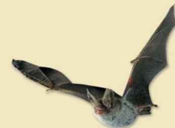
Murin de Bechstein

Le Murin de Bechstein est une espèce de chauve-souris dépendante des milieux boisés. Elle affectionne les vieux arbres où elle établit ses colonies.