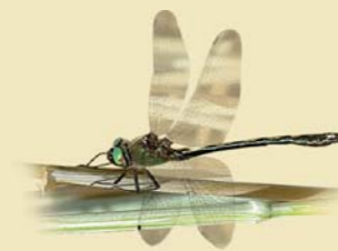
Oxycordulie à corps fin